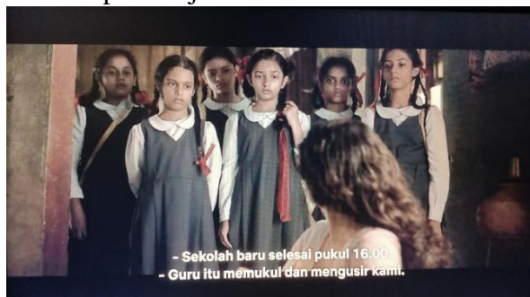
Gambar 9. Anak-anak Pulang Sekolah.

yang lain. Struktur plot sendiri terbagi menjadi 2 jenis yaitu pola linier dan pola non linier. Pada penelitian ini peneliti berfokus pada anak-anak PSK yang mendapatkan diskriminasi di sekolah dengan konvensi plot maju.