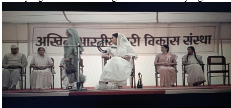
Gambar 10. Biarawati meninggalkan pertemuan.

Dalam dialog tersebut dapat terlihat mereka mendapatkan pukulan dari guru mereka dan diusir hanya karena mereka merupakan anak dari seorang pelacur. Diskriminasi yang terjadi dari prasangka suatu kelompok berdampak pada kelompok yang sebenarnya tidak bermain peran contohnya pada anak kecil ini, sehingga pada peristiwa naratif yakni adanya sebab akibat, sebab terjadinya diskriminasi tersebut akhirnya jurnalis yang ingin membantu Gangu pun mengundang Gangu dalam pertemuan besar yang membahas tentang hak asasi wanita yang akan menandatangani menteri dari India.