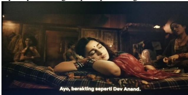
Gambar 4. Setting Suasana pada Rumah Bordil.

Pada awal cerita tempat dan waktu yang digunakan adalah rumah bordil dan malam hari karena pada awal cerita dikisahkan Gangu yang mulai menjadi seorang PSK, diperlihatkan lingkungan yang kumuh yang hanya berisi bangunan rumah bordil dan lilin kecil yang menyinari sekitar karena latar waktu pada film ini adalah tahun 60-an dimana masih jarang adanya listrik di India apalagi tempat terpencil seperti ini. Malam hari yang ditandai sebagai waktu dimana PSK mulai bekerja dan mencoba menarik hati lelaki yang berlalu-lalang disana untuk menyewa mereka dan menghabiskan malam dengan mereka. Pengambilan tone gambar yang sedikit hitam memberikan kesan suasana sedih pada kehidupan seorang PSK. Namun dibangun juga suasana bahagia karena wanita PSK ini saling bersama layaknya keluarga seperti pada adegan ini.