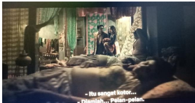
Gambar 5. Lokasi Rumah Bordil Gangu.

Lokasi dalam ruangan atau indoor ini kebanyakan berada di rumah bordir karena memang mengisahkan seorang aktivis yang memperjuangkan hak-hak wanita PSK. Lokasi yang diperlihatkan dalam film ini memberikan kesan kumuh dan kotor seperti adegan ini.