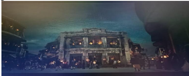
Gambar 3. Setting Tempat dan Waktu pada Awal Film.

Seperti yang dijelaskan Sumardjo, setting adalah tempat dan waktu berlangsungnya cerita dalam sebuah drama [2]. Tujuan setting adalah untuk memberikan informasi kepada penonton tentang tempat terjadinya adegan, seperti: rumah, gedung, waktu, musim, dan lain. Selain itu, latar berperan dalam mengidentifikasi situasi yang digambarkan dalam cerita. Setting dalam film Gangubai Khatiwadi diklasifikasikan menjadi setting waktu, tempat dan suasana seperti yang digambarkan pada adegan