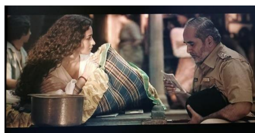
Gambar 2. Induk Primer Suap

Film bergenre drama menekankan kehidupan sehari-hari dan berisi deskripsi yang masuk akal tentang kondisi manusia. Genre drama utama Gangubai Khatiwadi terdiri dari konvensi peristiwa naratif. Peristiwa naratif adalah peristiwa yang terjadi pada sebab dan akibat, yang kemudian menjadi rangkaian cerita. Beberapa adegan dalam film ini menggambarkan sebab dan akibat dari keinginan Gangu untuk menjadi pemimpin Khamatipura.