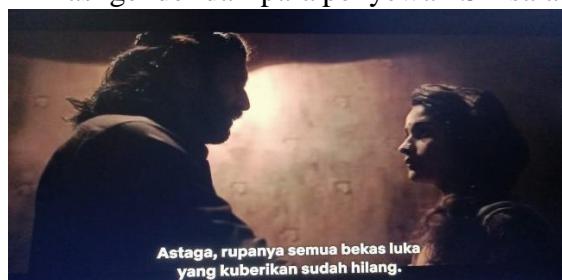
Gambar 6. Gangu disiksa salah satu penyewa

Karakter Gangu yang sejak awal selalu mengalami nasib buruk dan kerap mendapatkan diskriminasi gender dari para penyewa PSK salah satunya pada adegan ini.