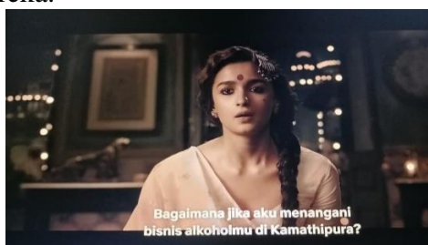
Gambar 1. Induk Primer kriminal.

Genre film dibagi menjadi genre induk primer dan genre induk sekunder, seperti yang dinyatakan oleh Pratista [8]. Jenis induk primer mencakup aktivitas, pertunjukan, inspirasi kekaguman yang otentik, mimpi, kebencian, parodi, kesalahan/kriminal, melodi, pengalaman perang dan western. Disaster, romance, spionage, biografi, detektif, film noir, superhero, melodrama, sports, travel, supernatural, dan thriller adalah contoh genre induk sekunder. Berdasarkan klasifikasi genre tersebut, film Gangubai Khatiwadi termasuk ke dalam kedua genre tersebut yakni genre induk primer yang memuat drama kriminal yang terlihat dari cerita Gangubai yang bekerjasama dengan Don Rahim Lala dalam menjual minuman keras di rumah bordir dan menyuap polisi untuk tidak menyita rumah bordir mereka.